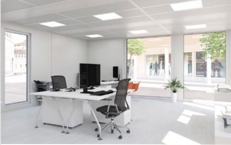
→ Hele vinduspaneler som gir lyse rom