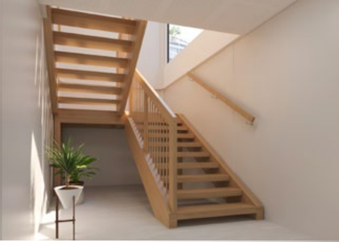
→ Innvendig trapp i heltre