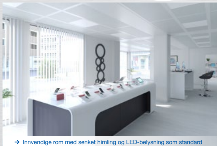
→ Innvendige rom med senket himling og LED-belysning som standard