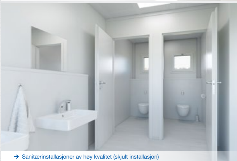
→ Sanitærinstallasjoner av høy kvalitet (skjult installasjon)