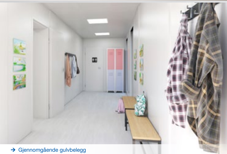
→ Gjennomgående gulvbelegg