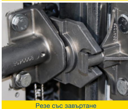
Резе със завъртане