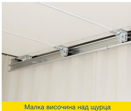
Малка височина над шурца