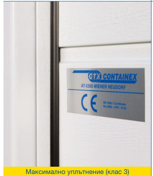
Максимално уплътнение (клас 3)