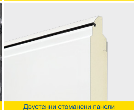
Двустенни стоманени панели