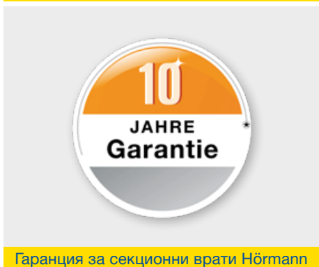
Гаранция за секционни врати Hörmann