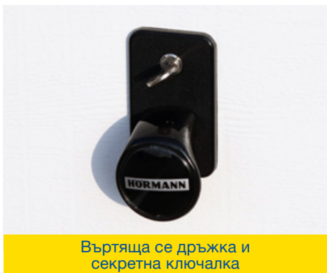
Въртяща се дръжка и секретна ключалка