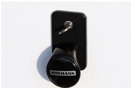
Klika s otočným kováním a profilovou cylindrickou vložkou