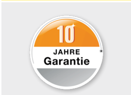
Záruka na sekční vrata Hörmann