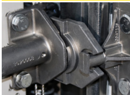
Uzamykací systém se západkou