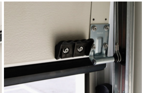
Velmi kvalitní pojezdové kolejniče