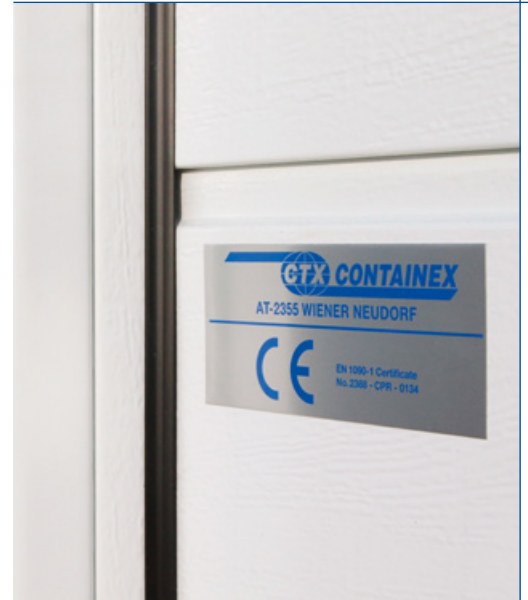
Vysoká těsnost (třída 3)