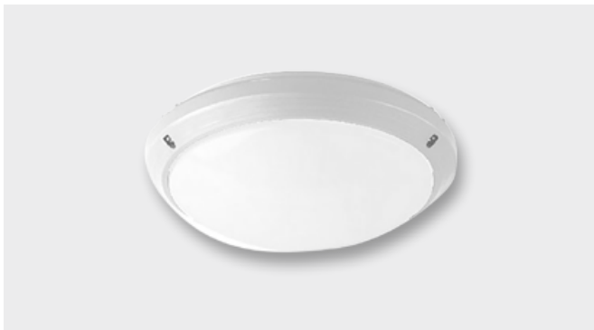
LED-Nurglasleuchte (8 W)