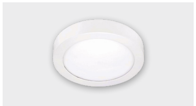
LED-Rundleuchte (17 W)