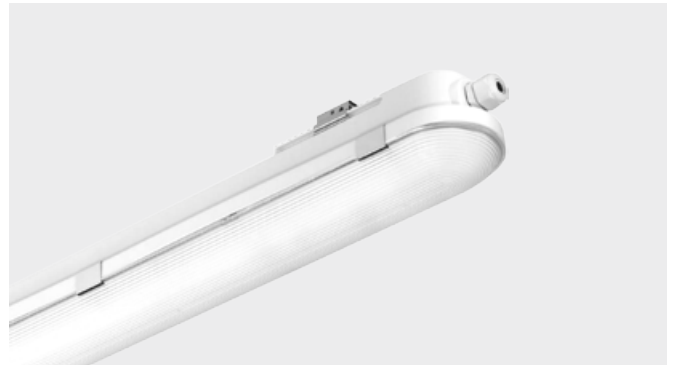
LED-Anbauleuchte (36 W/43 W)