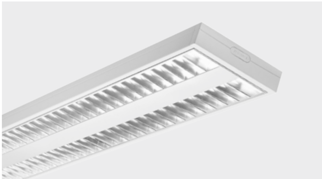
LED-Spiegelrasterleuchte (50 W)