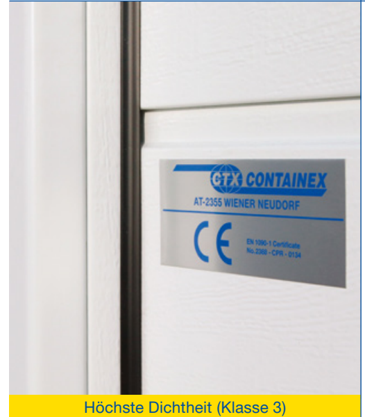
Höchste Dichtheit (Klasse 3)