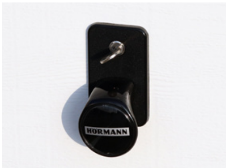
Kierrettävä kahva ja profiilisylinteri