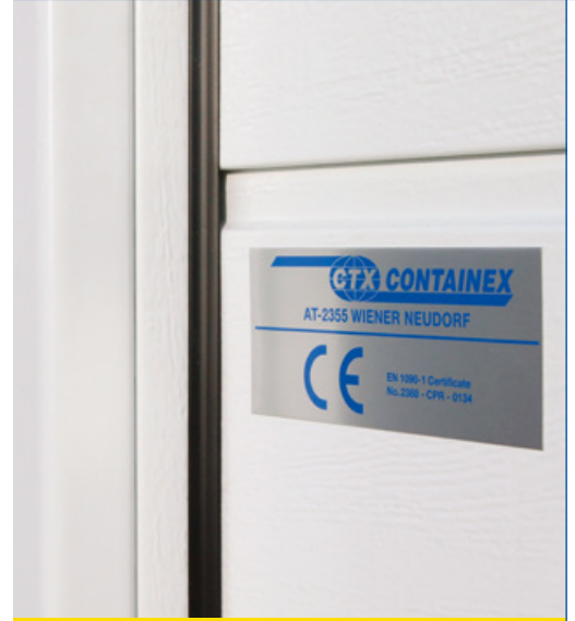
Korkein tiiviysluokitus (luokka 3)