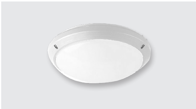
LED tejüveges lámpa (12 W)