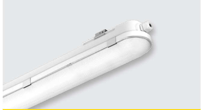
LED-lámpa (36 W/43 W)