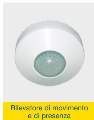
Rilevatore di movimento e di presenza