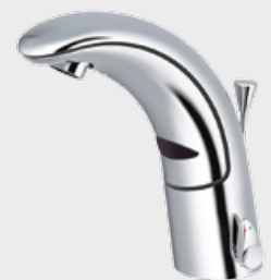
Miscelatore per lavabo con sensore automatico