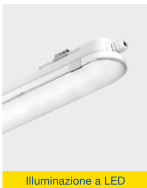
Illuminazione a LED