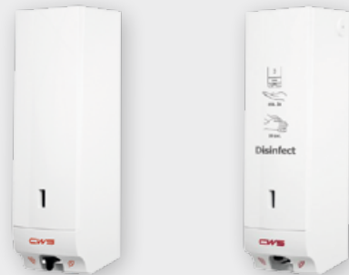
Dispenser di sapone e disinfettante con sensore automatico