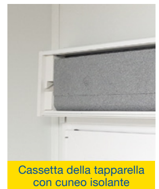
Cassetta della tapparella con cuneo isolante

* Disponibili in Paesi europei selezionati.