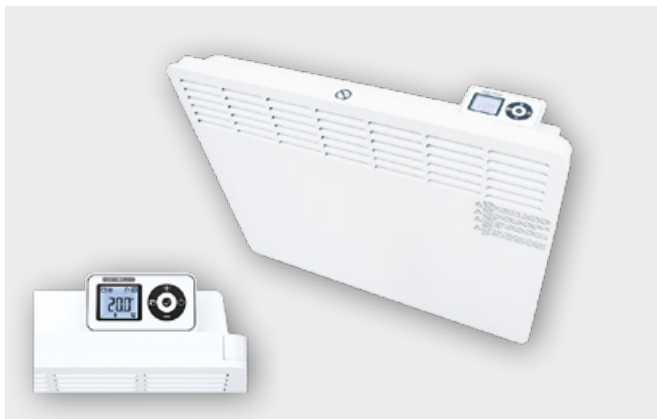
Riscaldamento con display thermostat