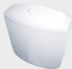
Sciacquone con funzione di risparmio