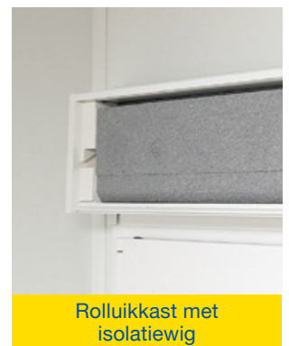
Rolluikkast met isolatiewig