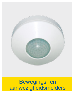
Bewegings- en aanwezigheidsmelders