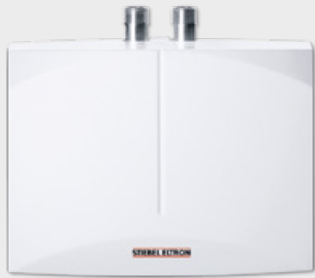
Geiser voor fonteintje