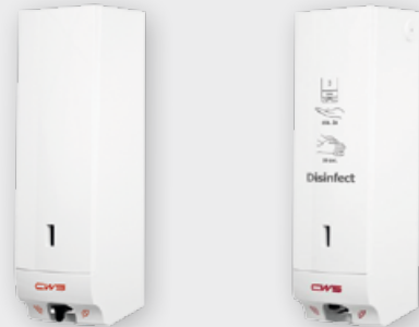
Contactloze desinfectiemiddel en zeepdispenser