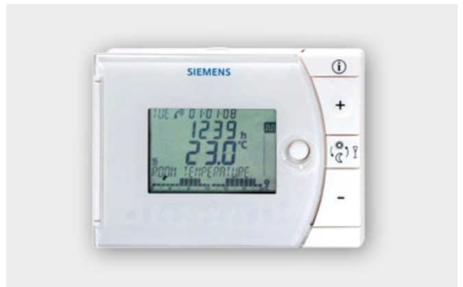
Bediening centrale verwarming