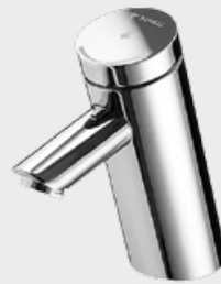
Stop & Go armatuur