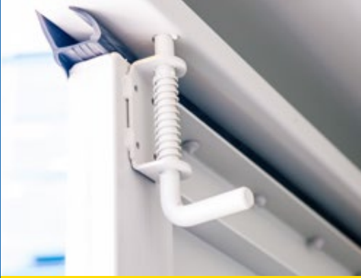
2 aan de binnenkant liggende vergrendelingen