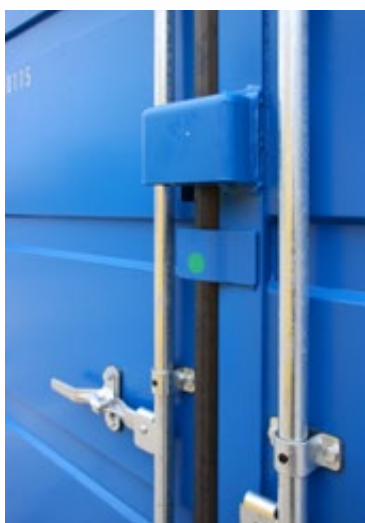
Het slot is beschermd