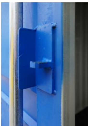
Bevestiging voor hangslot