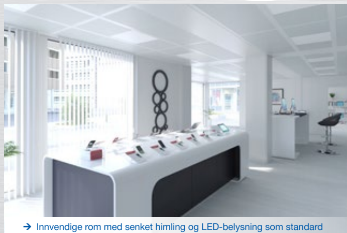
→ Innvendige rom med senket himling og LED-belysning som standard