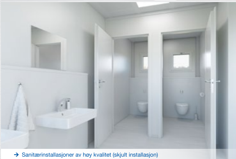
→ Sanitærinstallasjoner av høy kvalitet (skjult installasjon)