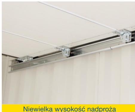
Niewielka wysokość nadproża