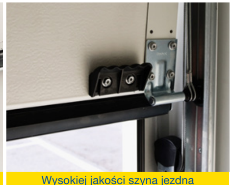
Wysokiej jakości szyna jezdna