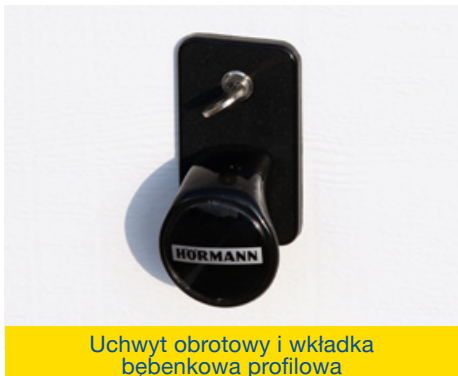
Uchwyt obrotowy i wkładka bębnekowa profilowa