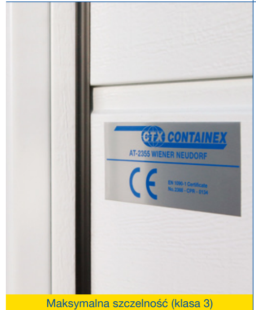
Maksymalna szczelność (klasa 3)