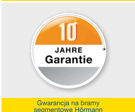
Gwarancja na bramy segmentowe Hörmann