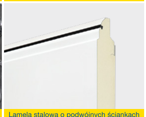
Lamela stalowa o podwójnych ściankach