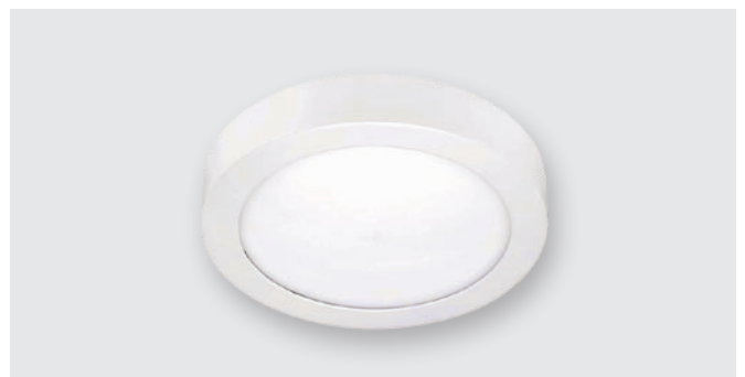
Светодиодный круглый светильник (17 W)