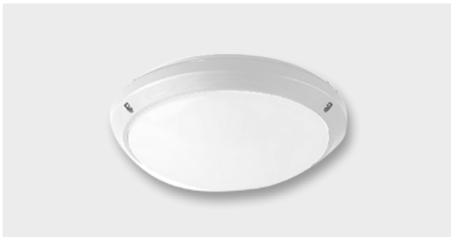
Цельностеклянный светодиодный светильник (8 W)