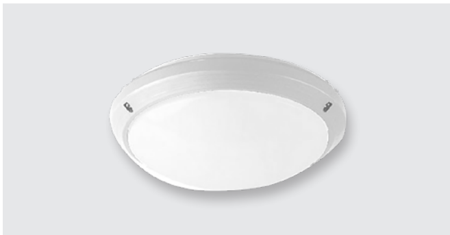
Цельностеклянный светодиодный светильник (12 W)