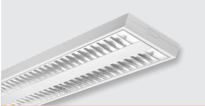
Светодиодный светильник с зеркальным отражателем (50 W)