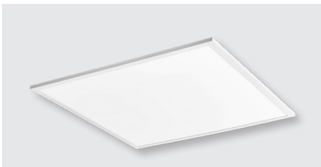
Светодиодная панель (27 W)