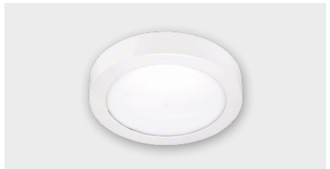
Светодиодный круглый светильник (17 W)