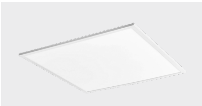
Светодиодная панель (27 W)