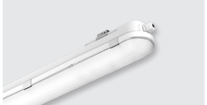
Накладной светодиодный светильник (36 W/43 W)