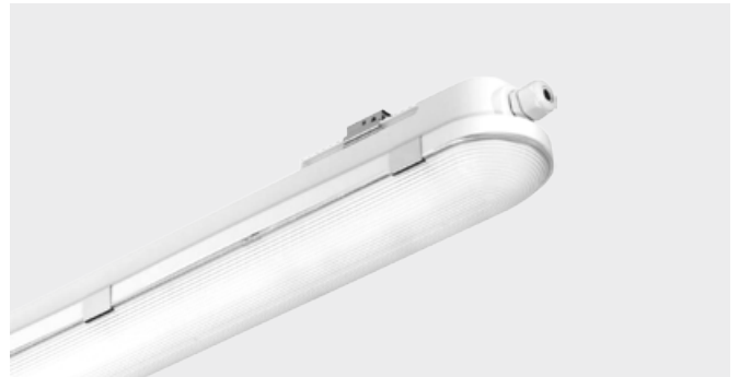
Накладной светодиодный светильник (36 W/43 W)