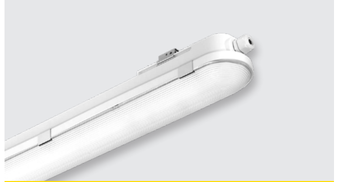
Montažna svetiljka LED (36 W/43 W)